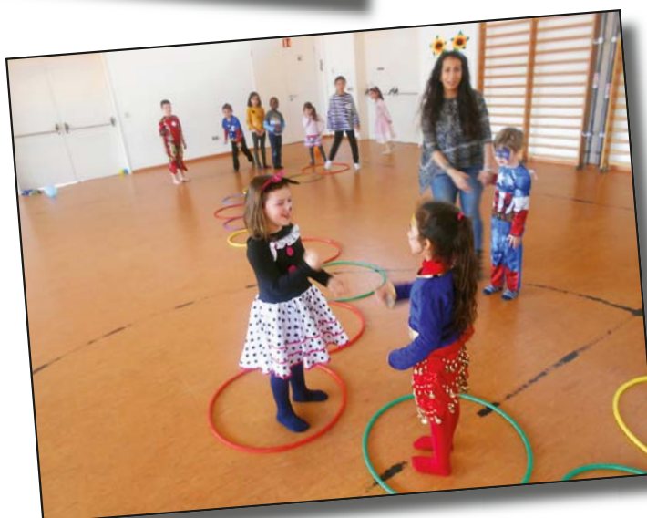
Fuesend am Koschteschbau