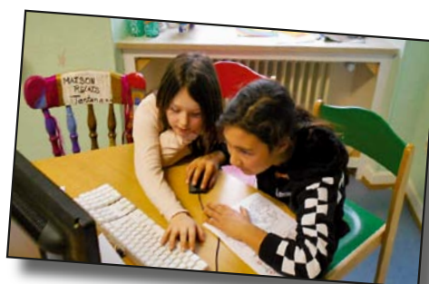
Hei schaffen d'Kanner un der Kannerzeitung vun der Maison Relais