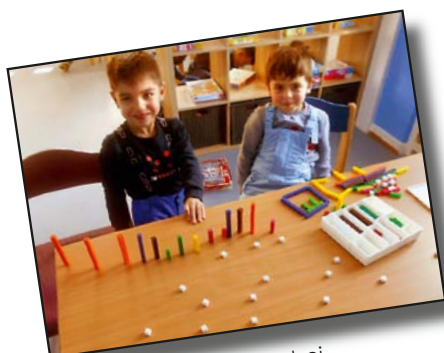
D'Kanner bei der Fräizäitaktivitéit