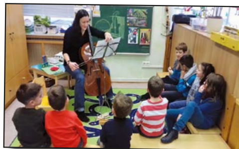
D'Kanner lauschteren no beim Cellospiller