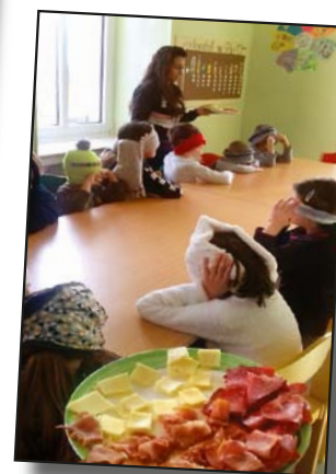
D'Kanner schmaache mat den Aen zou