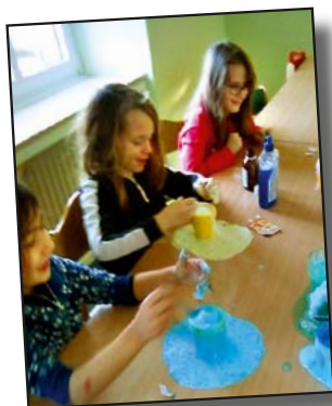
D'Kanner maachen Experimenten mat Schaum