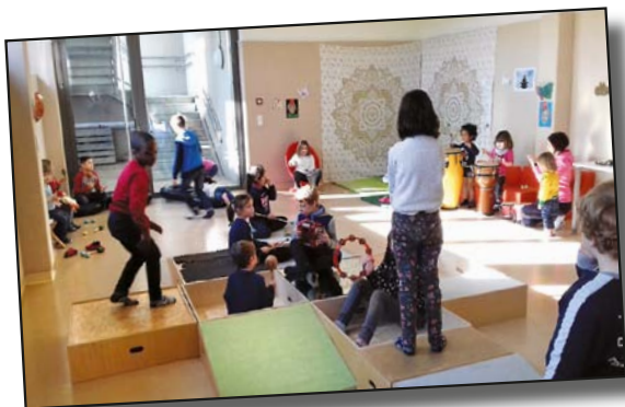
Musikaktivitéit vun der Maison Relais an der Crèche