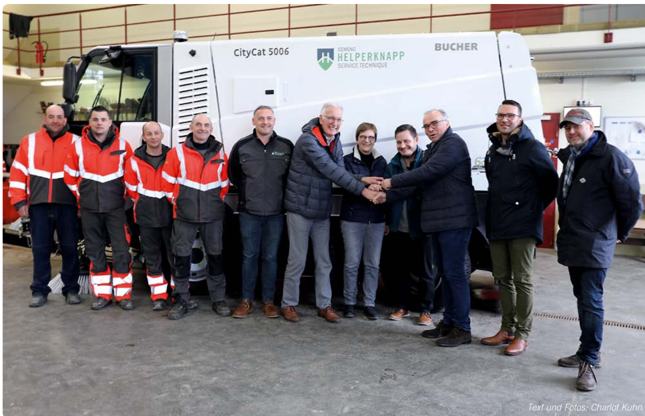
Text und Fotos: Charlot Kuhn